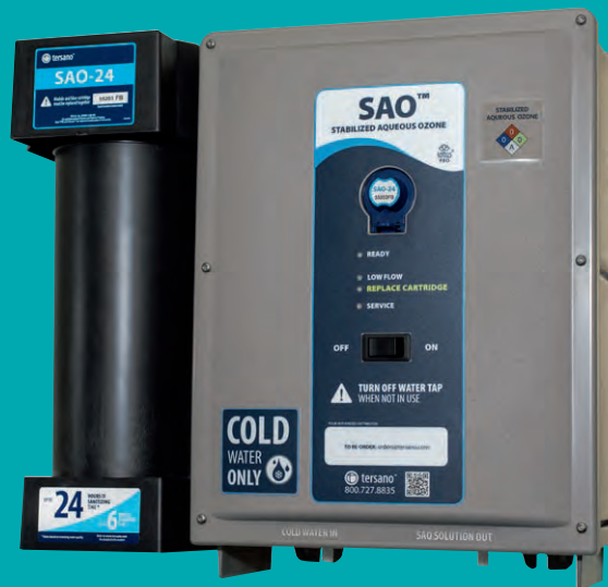
Tersano SAO™ Dispenser